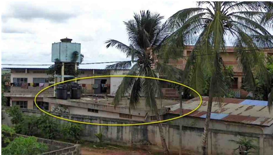
Emplacement de la nouvelle salle (1er étage)

Un financement important a déjà été accordé par le WBI dans le cadre du projet de coopération bilatéral Belgique-Bénin, des financements complémentaires sont en cours d'étude.